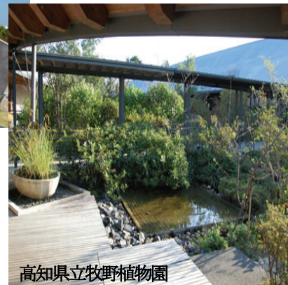
高知県立牧野植物園