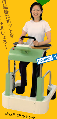
歩行王(アルキング)