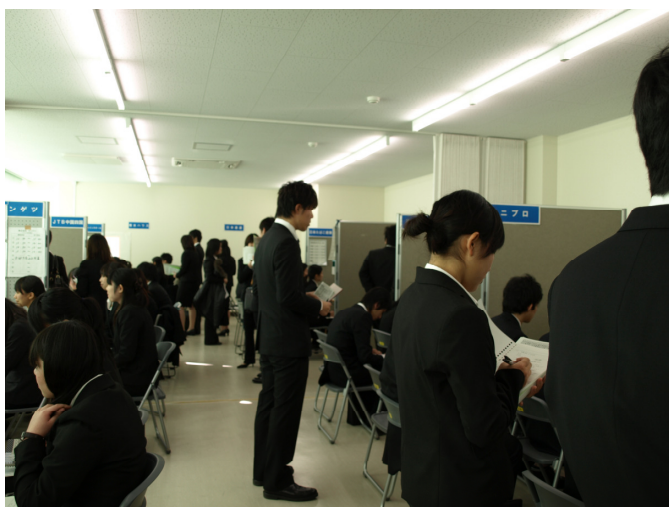
【ブースのイメージ】