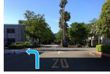
③左手の横断歩道を左折します。