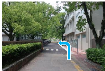
⑧横断歩道を左折します。