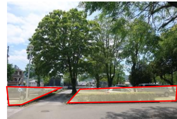
⑥駐車スペースです。