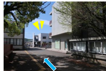
⑨希望創発センターの建物が見えてきました。