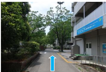
⑦駐車後、OASISの青い看板を右手に見ながら直進します。