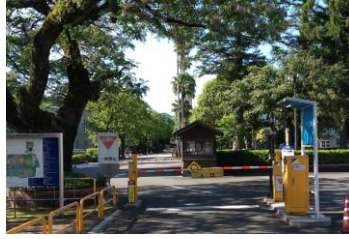
②ゲート手前で一旦停止し、駐車券発行機から駐車券を抜き取り入構してください。