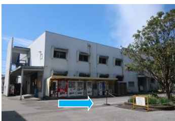
⑩自動販売機の前を通り抜けます。