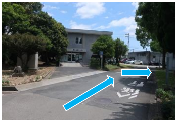
④道なりに進んでください。