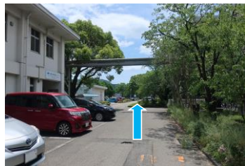
⑤突き当たりまで直進します。