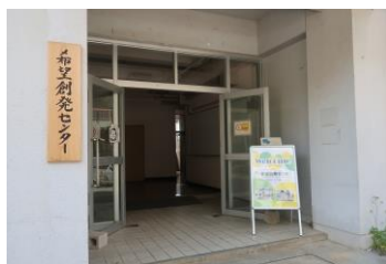
⑪希望創発センターは2階です。