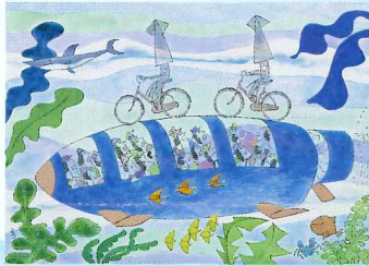
「海底旅行」横山隆一