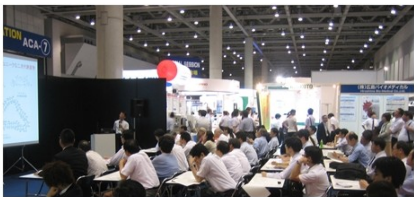
(下) 発表会場の様子