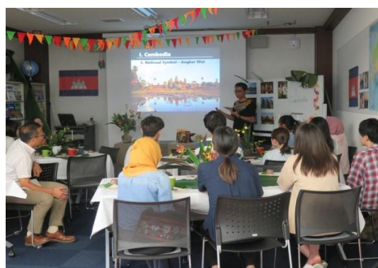
21 st Cambodian Culture Cafe