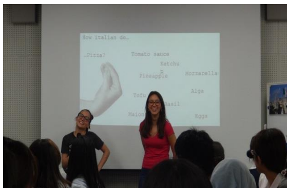
19 th Italian Culture Cafe