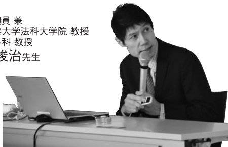
参議院議員 兼 慶應義塾大学法科大学院 教授 医学部外科 教授 古川 俊治先生

： について話があり、講演会の参加者たちは真剣な面 ： 持ちで耳を傾けていました。特に「患者暴力への対 ： 応」については、病院で働く職員にとっては重要な ： 問題であるため、参加者から個別の質問が挙がる場 ： 面もありました。講演は18時30分から約1時間にわ ： たって行われ、講演終了後にも古川先生と談笑する ： 参加者の姿が見られました。