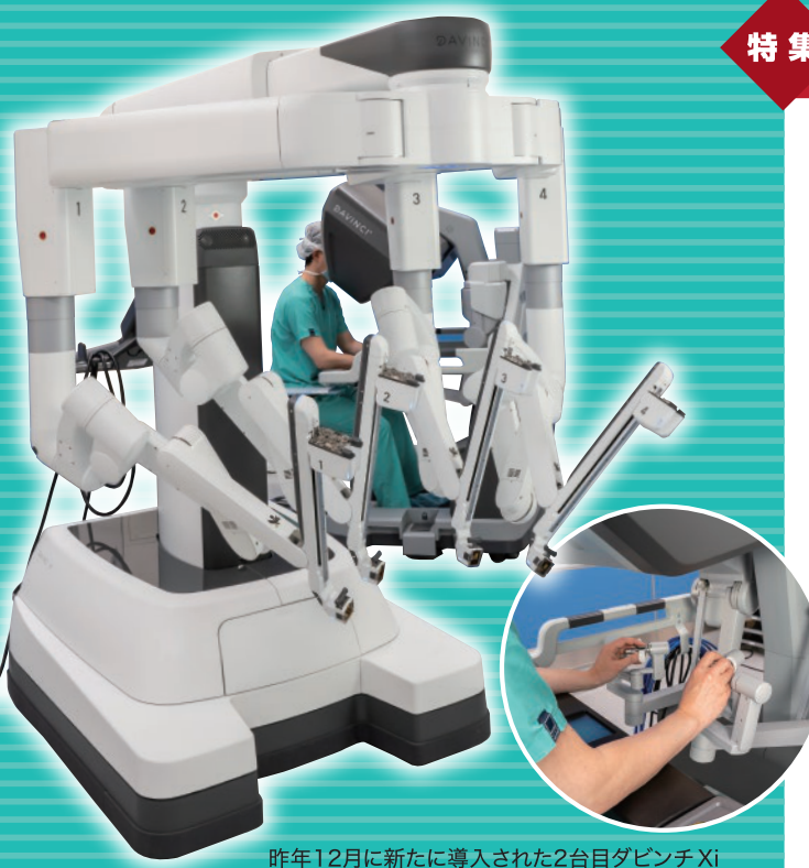
昨年12月に新たに導入された2台目ダビンチ Xi

これだけ優秀な外科医たちと高レベルのテクノロジーを備えた高知大学医学部附属病院をもっと気軽に使っていたきたい。