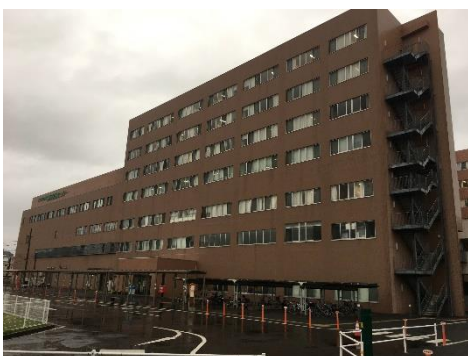
静岡医療センター外観

静岡医療センターでの実習は、採血などの手技をさせて頂く機会があったり、問診を取りに行き入院時カルテを記載するなど、大学病院での実習よりも、初期研修医と近い立場で実習ができる環境でした。そのため初期研修医になる前に、どのような研修がしたいか、初期研修でどんなことをできるようになりたいか、さらにはどんな医師になりたいか、ということより具体的に考えるきっかけになりました。指導医の先生方にも時折進路相談に乗って頂き、将来の進路を考える上でとても参考になりました。これまで自分が考えていた以上に色々な選択肢があることを知り、視野が広がったように思います。このように、将来の進路をより具体的に考えられるようになったということも、静岡医療センターの実習に参加して良かったと感じる大きな点です。