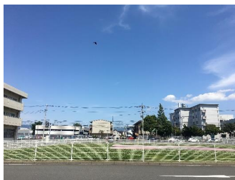
病院前のヘリポート