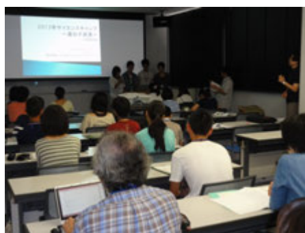
サマー・サイエンスキャンプの様子