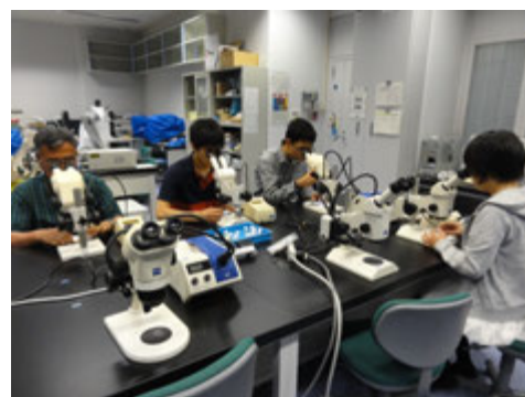
世界の砂観察@顕微鏡室