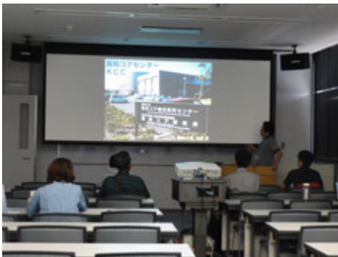
センター紹介@セミナー室