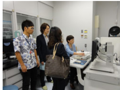
CT スキャンデモ@コアロギング室