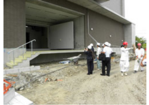
海洋コア新棟視察