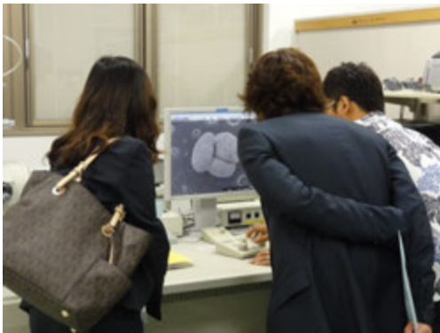
電顕デモ（微化石観察）@電子顕微鏡室