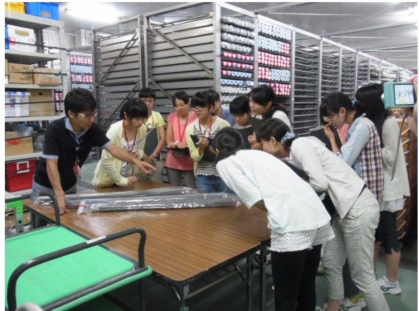
館内ツアーの様子