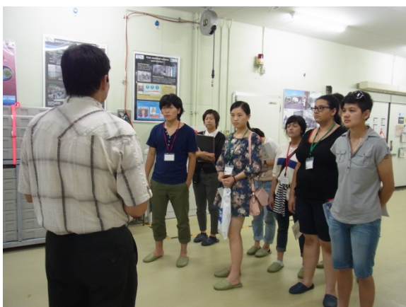
コア保管について@保管庫前