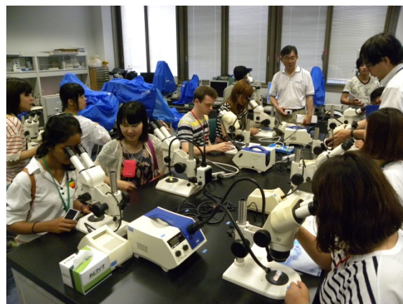
「世界の砂」観察@微化石画像処理室