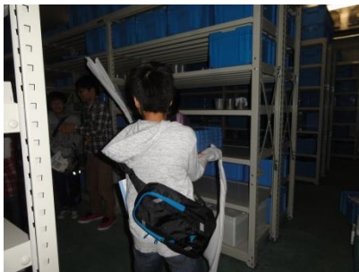
海洋コアの観察&ぬれたタオルが凍る！マイナス20℃体験@1番コア保管庫