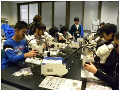
「世界の砂」実体鏡観察@微化石画像処理室