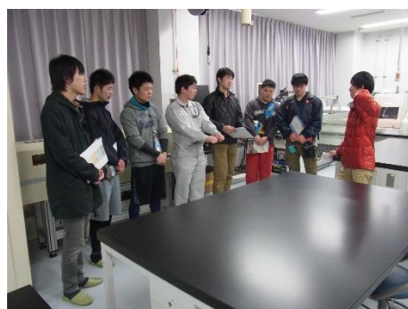
非破壊計測の紹介@コアロギング室