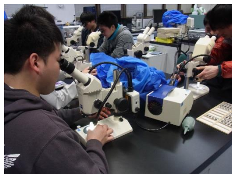
「世界の砂」実体顕微鏡観察@微化石画像処理室