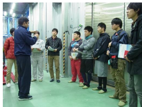
IODP コアの紹介@B棟コア冷蔵保管庫