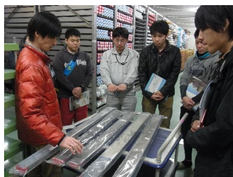
海洋コアの観察@1番コア冷蔵保管庫