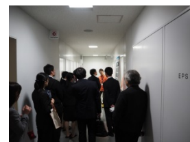
非破壊計測機器，実物のコア，サンプリング風景の解説と実験棟の見学