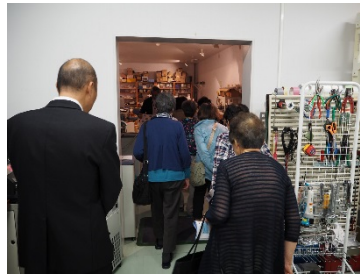
古地磁気シールドルーム で方位磁針実験