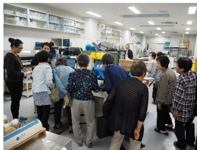
サンプリング室で IODP サン プリング作業を見学