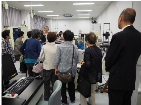
コアロギング室見学