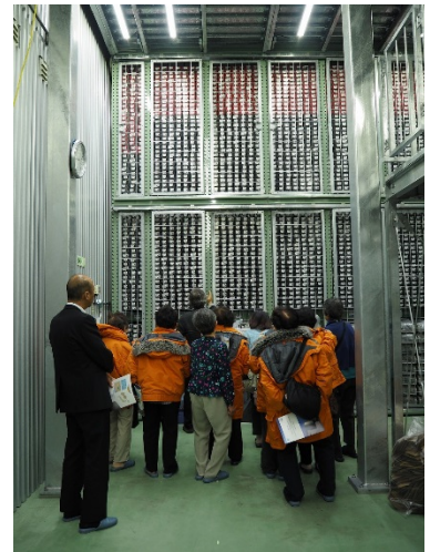
IODP 冷蔵コア保管庫見学