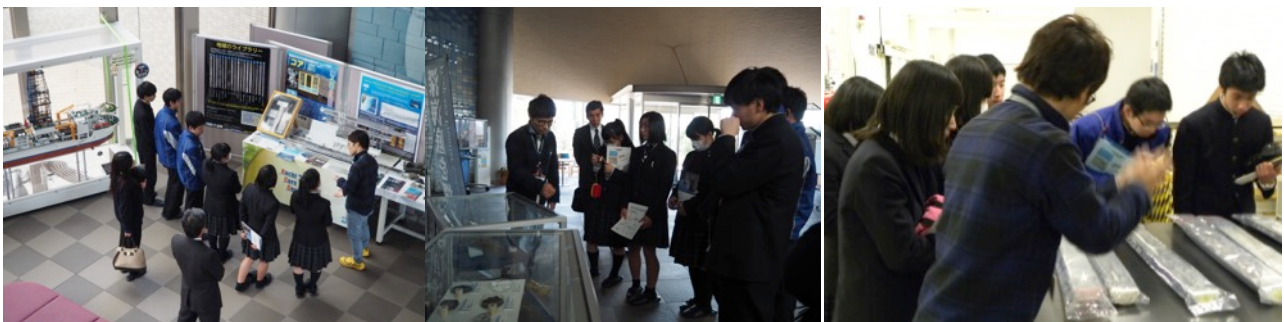
「ちきゅう」, ジオパーク, レアメタルなどの展示