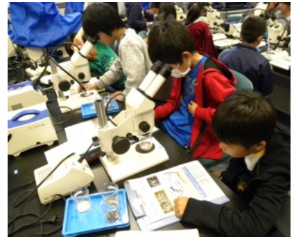
実習『堆積物の観察』の様子