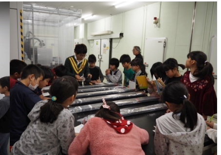
「ちきゅう」模型，非破壊計測機器，海洋コア 5 試料（実物）