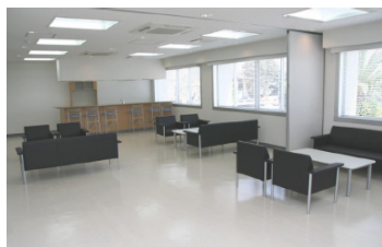
ホール兼交流ラウンジ(総合研究棟 2階 エレベータの向かい、階段横)