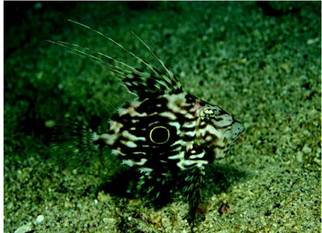
写真 2. 大月町柏島で撮影されたマトウダイ

蒲原博士は 1929 年から高知県西南部の 柏島 かしわじま と沖の島 あしずり 、足摺地方沿岸の魚類の調査を 開始しています。1960 年の研究報告では、 西南部沿岸の魚類を約 600 種としました。そ の後、1969 年以降に柏島周辺では漁獲物や 釣りでの採集、1980 年代からはスクーバ潜水 せんすい による調査が行われ、1996 年には 143 科 884 種がリストにまとめられました。研究中 の未発表の種を含めると、およそ 1,000 種が 生息するとされました。1996 年以降も柏島 で採集された標本により新種や初記録種が発