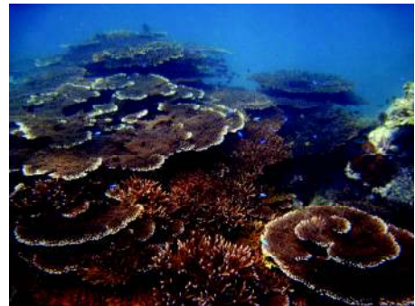
写真2. 造礁サンゴ類

一方で造礁サンゴは増加の傾向を示しています。高知県には150種ほどの造礁サンゴが分布していますが、近年、以前は生息していなかった熱帯性の種が増加する傾向が見られます。藻場が消失し、磯焼け状態になった海底に造礁サンゴ類が繁茂するようになった場所も少なからずあるようです（写真2）。