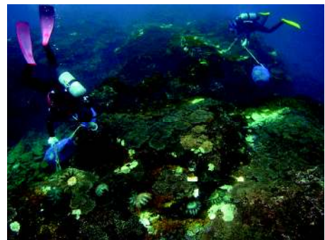
写真3. オニヒトデの駆除活動

藻場の減少と造礁サンゴの増加による沿岸海域の動物相の変化は、水産業に大きな影響を与えています。テングサや岩ノリなど有用海藻の減少やアワビやトコブシなど高級食材である藻食性巻貝類の減少は各地で海土漁に大きな打撃を与えています。そのため藻場の造成事業が盛んに行われていて、特に最近では、磯焼けした海底に多量に生息しているウニ類の除去を伴う藻場再生事業が各地で実施されており、効果が期待されています。