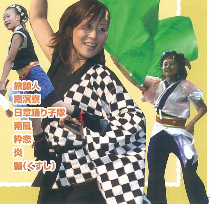
旅鯨人 南涙寮 日章踊り子隊 南風 粋恋 炎 醫(ぐすし)