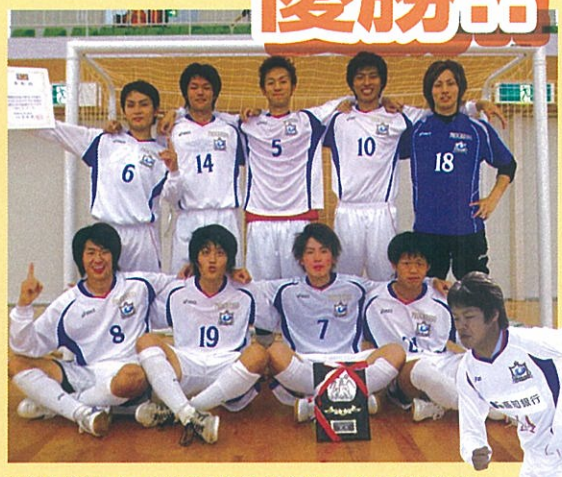
高知大学サッカー部が6月12日に行われた四国地区予選 で優勝し、全国大会出場を決めました!全国大会は8月27 日に大阪で開催決定!好成績を残せるよう、頑張ります!!!