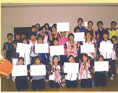
応援旗に書かれている「歩」は、学業もスポーツも少しずつステップ アップしていこうという思いが込められています。

男子17名、女子19名の医学部 卓球部。卓球は力打とうとし ても無理なスポーツ。いろいろな タイプの選手と対戦しながら技 術を磨いています。 卓球の団体戦は5名。みんなの 応援を力に、チームでの勝利に こだわっています。前年度は、西 医歯薬学生卓球大会にて女子シ ングルス準優勝のほか団体戦入 賞するなど、全国レベルの大会で も好成績を収めています。