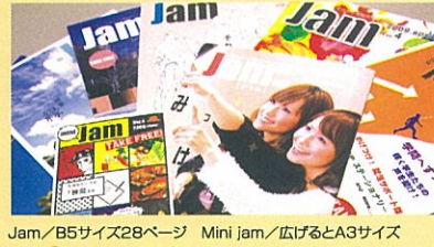
Jam/B5サイズ28ページ Mini Jam/広げるとA3サイズ