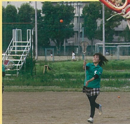
ラクロスはサッカーの空中版と言われます。クロスと言われ るスティックを用いて12名(女子)でゴールをねらいます。