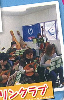
マンドリンクラブ