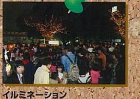
イルミネーション