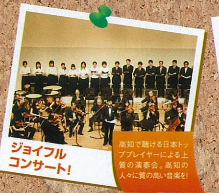
ジョイフル コンサート!

8月6日に朝倉・物部キャンパスにて開催し1,000名(県外約500名)が参加しました。