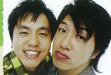
アメリカザリガニ