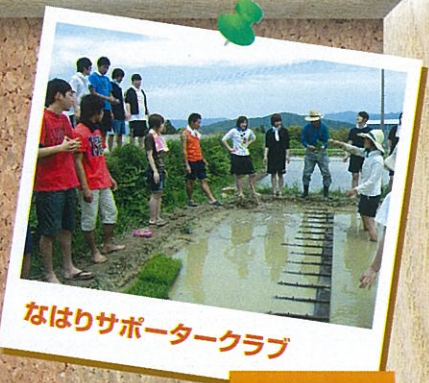
なはりサポータークラブ

なはりサポータークラブは、奈半利町米ヶ岡地区の住民の方々と一緒に活動しています。