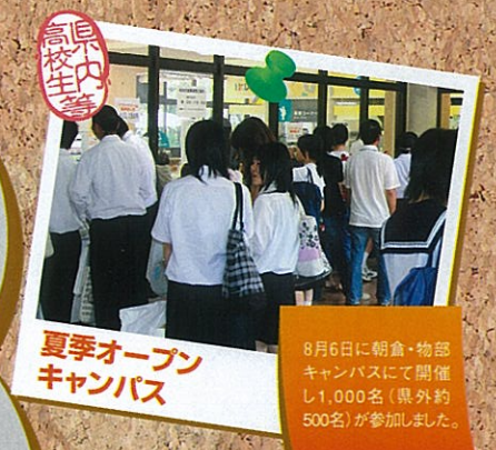
夏季オープン キャンパス

8月6日に朝倉・物部キャンパスにて開催し1,000名(県外約500名)が参加しました。