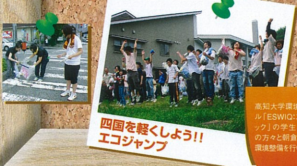
四国を軽くしよう!! エコジャンプ

冒険!発見!くらしの旅!!高知市文化プラザ「かるぽーと」にて8月28日~9月2日まで開催し、約2,200名が来場しました。