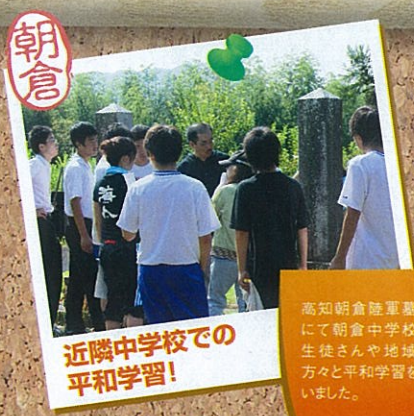
近隣中学校での 平和学習!

高知市中央公園にて高知大学、高知女子大学、高知工科大学の学生たちが地域活性化と交流を目的に開催し、たくさんの方が来ていただきました。