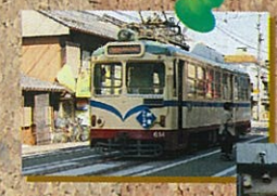
土佐電鉄 電停名変更