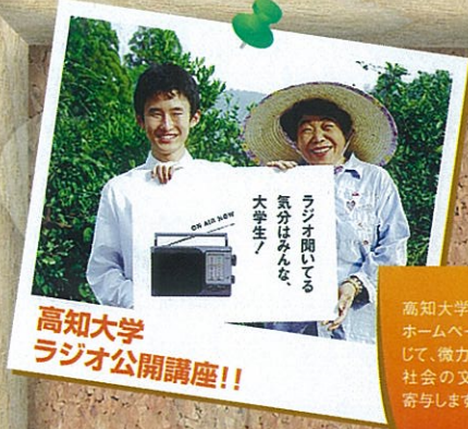
高知大学 ラジオ公開講座!!

高知大学がラジオやホームページ、本を通じて、微力ながら地域社会の文化振興に寄与します。