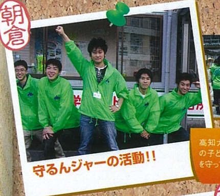
守るんジャーの活動!!

なはりサポータークラブは、奈半利町米ヶ岡地区の住民の方々と一緒に活動しています。