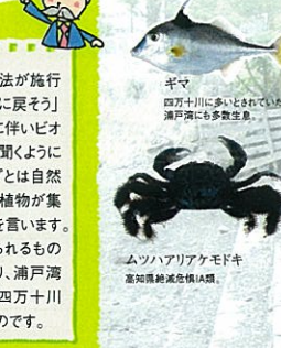
浦戸湾に住む生き物たち アガメ 高知県絶滅危惧種IA類、環境省指定準絶滅危惧種。2016年に発見されたが、人の釣りなどで捕らわれる。 ムツナリアアケボトキ 高知県絶滅危惧種IA類。 カフスナガニ 環境省指定準絶滅危惧種。 アマメノコサザガニ 浦戸湾にはこの種のメノコサザガニが生息。

浦戸湾は珍種・希少生物のワンダーランドだ。 約30年前、浦戸湾は誰も近づきたくない海でした。当時、パルプ工場からの廃液が江の口川に垂れ流しにされ、海はチョコレート色だったのです。 1971年「水質汚濁防止法」が成立。工場からの廃液もなく、川の水や海水は徐々に現在の状況になってきました。 高知の公害史の舞台を、一気に引き受けた浦戸湾には、全国でも絶滅危惧種がたくさんいるという。なぜこの土地にたくさん生物がいるかは、まだまだ謎。しかし、生物を生かしておくことは、私たちの使命ではないでしょうか。