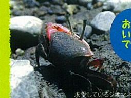
JR高知駅 Honda Cars レクサス おウフ 新堀小学校 四国銀行 はりまや橋

新堀川でシオマネキを見つけてみよう！ 現在、新堀川には5種類の蟹がいます。大正橋から橋の下を眺めると小さな穴がゴコゴコ空いています。しばらく見てみると、遊んでいるたくさんの蟹の姿に気付くでしょう。「こんな所に！」の驚きの出会いです。 県庁所在地で簡単にシオマネキが見られるのは全国でもココだけという貴重な場所なのです。