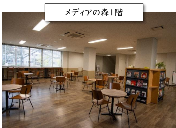
さきがけ志金による支援により、リニューアルされたリフレッシュコーナー