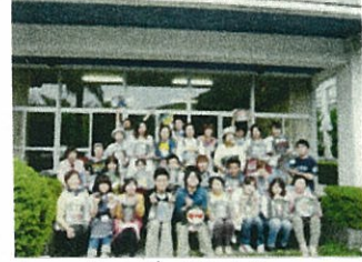
さいごは集合写真