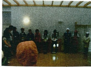
大野見に到着! 乙女との出会いに絆♥