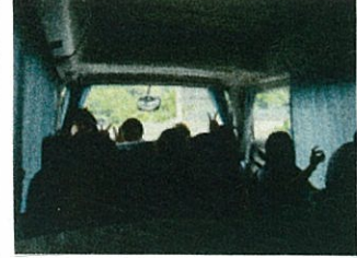
乙女の待つ大野見へ出発!!