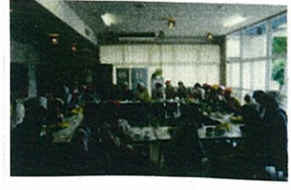
みんなぞ! いただきます