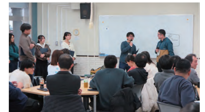
最終報告会の様子

報告会終了後には、その研究成果について論述する「個人論述書」、一年間の活動を振り返りながら社会における希望をどのようなものと考えようになったかを記述する「リフレクションレポート」を提出。翌6月中旬までにチーム担当のファシリテーターが全員にフィードバックを送付し、活動を終了します。