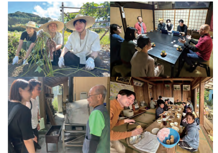
現地調査／インタビューの様子

そうした力を身につけていくために、本研究会では高知県内外で活躍する社会人と高知大生が約一年間にわたりチームを組んで活動を行っています。現場や現物、そして現実に向き合う「三現主義」を大切にしながら、多様な才能や経験を持つ同時代に生きる人々が顔を合わせ、「共に語り、共に学び、共に知る」ことに取り組んでいくことで、 現代社会に新たな地平を拓くイノベーション人材 を育てていきます。