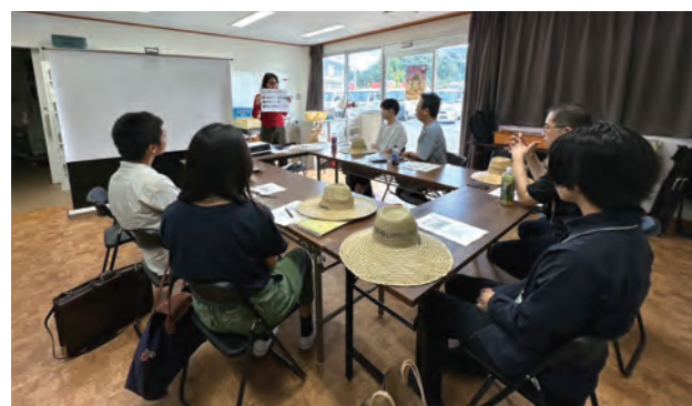
現地調査／インタビューの様子

多様な業種・地域から参加する企業人メンバーと、本学においてさまざまな分野を学ぶ学部生・大学院生からなる 5～6名の混成チームで活動 を行います。各チームには、研究会の理念に共鳴する 本学教員1名と企業人ファシリテーター1名が参加 し、各チームの活動の支援や例会の進行、メンバーのキャリア支援や信頼関係の構築にあたります。