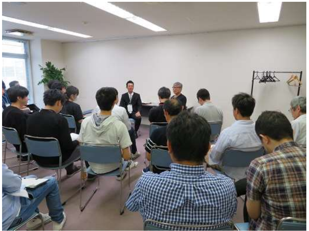
1日目交流会冒頭に、養殖場のカンパチの試食会が行われ、新鮮ですっきりした濃厚さを持つカンパチの味わいに、参加者一同驚いていました。