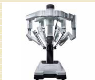
ベイスントカート(ロボット部)

平成24年に手術室に導入された手術支援ロボット「ダビンチ」“Sシステム”に続き、平成29年夏には最新機種“Xi”システムを四国で初めて導入しました。これまでの機種と比べて格段の取り回しの良さ、鮮明な画質、新たな機器や新技術に対応ができるものであり、安心安全な低侵襲手術をより幅広く発展させることが期待されています。