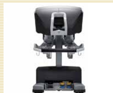
サージョンコンソール(執刀医の操作台)