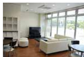
各階にラウンジがあります。