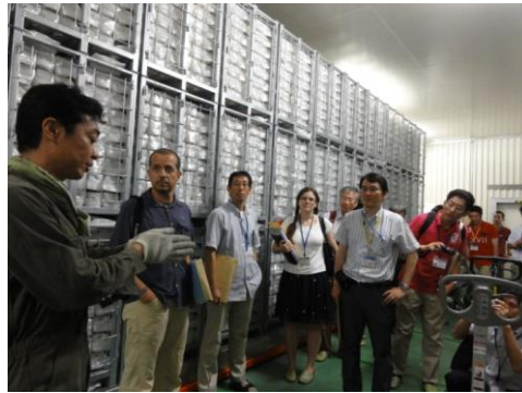
A 棟 IODP コア保管庫