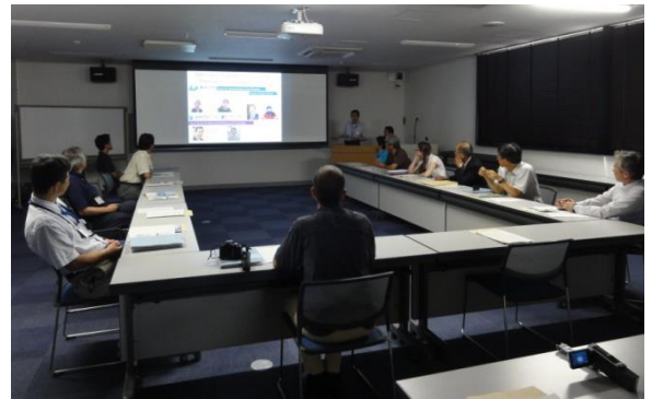
KCC 概要説明@セミナー室