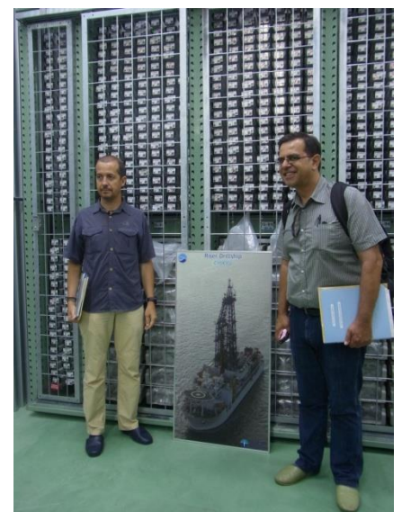
IODP コアの紹介@B 棟コア保管庫