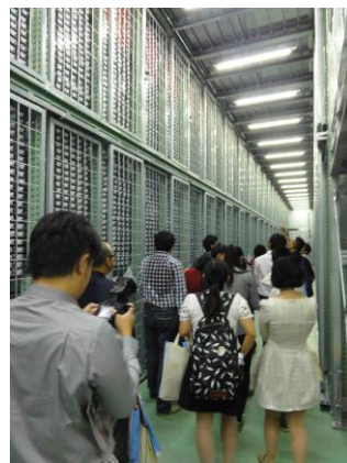
IODP コアの説明@新棟コア冷蔵保管庫