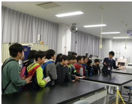
非破壊計測機器の説明@コアロギング室