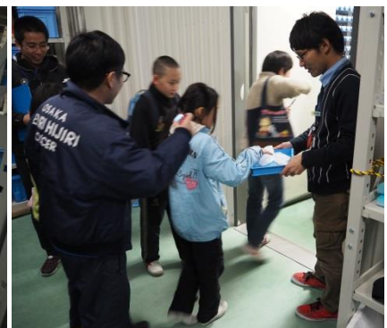
南極の水に触った！！