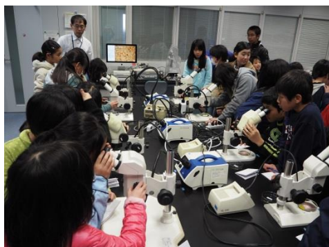
堆積物の観察@微化石画像処理室