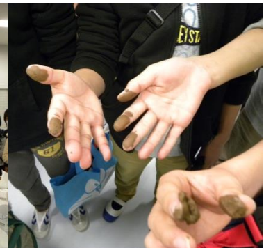
海底の堆積物に触ってみた