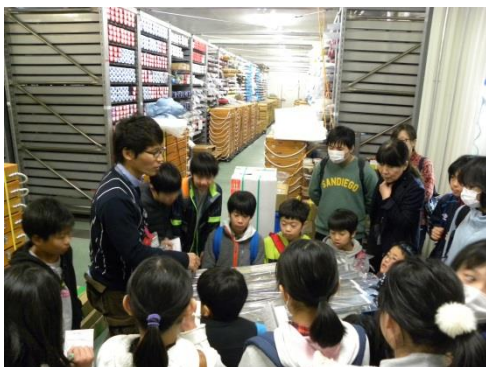
海洋コアの観察 @第1コア冷蔵保管庫