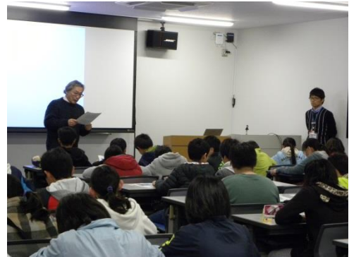
地震・防災の講義@セミナー室